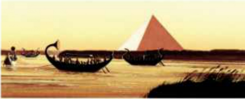
(شكل ١٠١) حركة التجارة الداخلية

يقصد بها: حركة البيع والشراء التي تتم بين القرى والمدن المصرية، وكان النيل شريان المواصلات الأول في نقل البضائع من مدينة إلى أخرى.