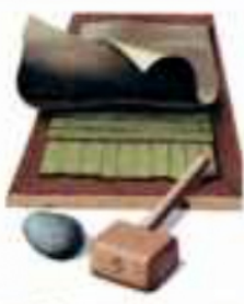
(شكل ١٠٠) صناعة الورق