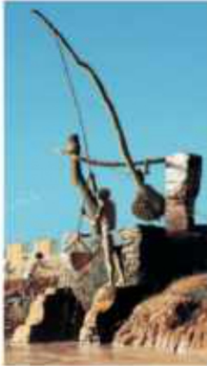
(شكل ٩٥) شادوف