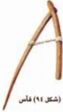
(شكل ٩٤) فأس

استخدم الفراعنة أدوات كثيرة في مجال الزراعة، هل تعرف ما هي؟ لاحظ الصور التي أمامك، وتعرف عليها: