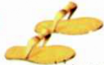
(شكل ٩٩) ثعلال مصنوعة من الجلد

مثل: دباغ الجلود، وصبغها؛ حيث صنع منها أغطية المقاعد، والوسائد، والنعال، والسُّيُور.