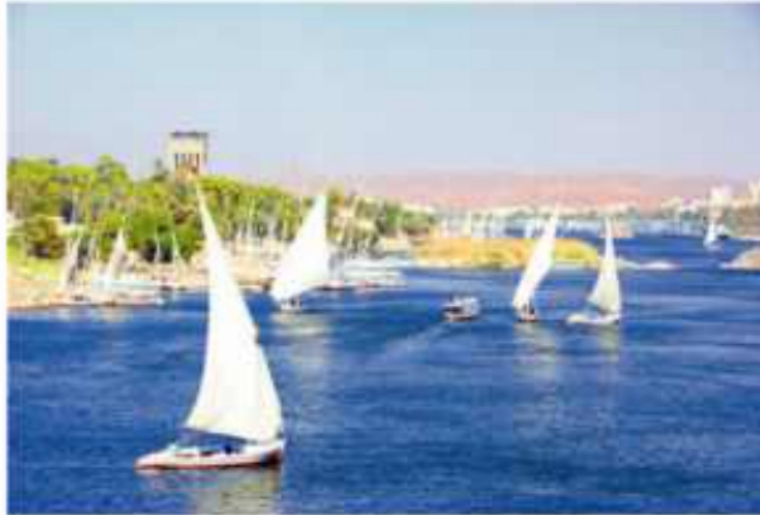
(شكل ٩٢) نهر النيل

لَقَدْ وَهَبَ اللهُ مِصْرَ طَبِيعَةً جَمِيلَةً ، غَنِيَّةً بِمَوَارِدِهَا ؛ فَفِيهَا يَجْرِي نَيْلٌ قِيَاضٌ ، أَخْصَبَ أَرْضَهَا وَمَلَأَهَا بِالْخَيْرَاتِ ، وَبِهَا صَحَارٌ مُلْتَمَتْ بِشَتَى الْكُنُوزِ مِنْ أَلْوَانِ الصُّخُورِ وَالْمَعَادِنِ مِمَّا جَعَلَ حَيَاةَ الْمِصْرِيِّينَ مَيْسِرَةً حَيْثُ حَقَّقُوا مَا أَرَادُوا.