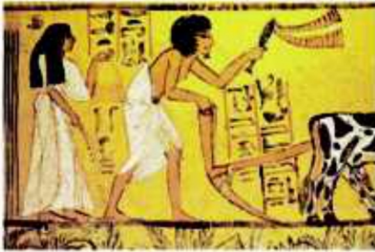
(شكل ٩٣) الزراعة في مصر القديمة

والآن، ما بنا نتعرف المزيد عن كل مجال ولتبدأ بـ