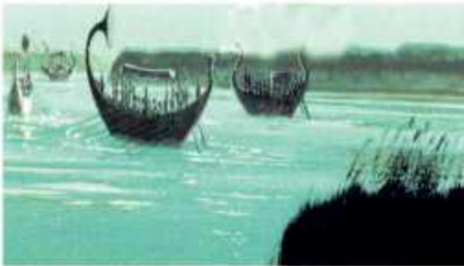
(شكل ١٠٢) حركة التجارة الخارجية

يقصد بها: حركة البيع والشراء التي كانت تتم بين الدول بعضها البعض؛ حيث كونت مصر علاقات تجارية مع بلاد (فينيقيا - بونت) لجلب الأخشاب، والبخور، والجلود والعاج من هناك عن طريق السفن التي كانت تبحر عبر البحرين: الأحمر والمتوسط