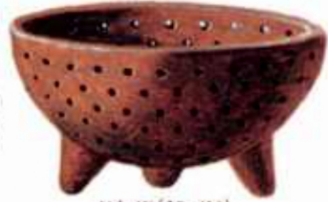
(شكل ٩٦) إناء فخار

أبدع المصري القديم في صناعة الأواني الفخارية منذ أقدم العصور حيث نقش عليها الرسوم والمناظر الجميلة.