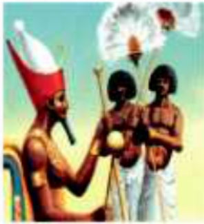
(شكل ٨٥) الملك و موظفيه

• الدفاع عن البلاد ، وصد المعتدين وإقامة العدل بين الناس وتأمين وسائل الحياة الكريمة لهم.