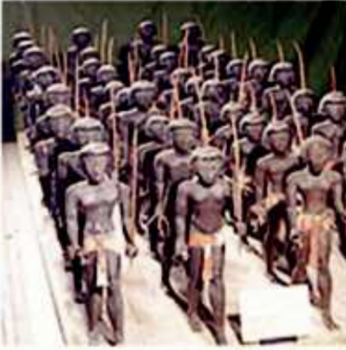
(شكل ٨٨) الجيش في مصر القديمة