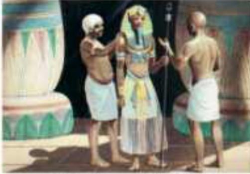
(شكل ٨٧) الوزير مع بعض معاونيه

عرفت مصر وجود نظام الإدارة المحلية قبل وحدة البلاد حيث كان لكل إقليم حاكم مستقل وبعد الوحدة أصبح حكام الأقاليم يعينون بواسطة الملك ويقومون بمهام معينة.. منها الإنابة عن الملك في إدارة الإقليم من حيث ( حفر الترع - خزن الغلال - حفظ الأمن )