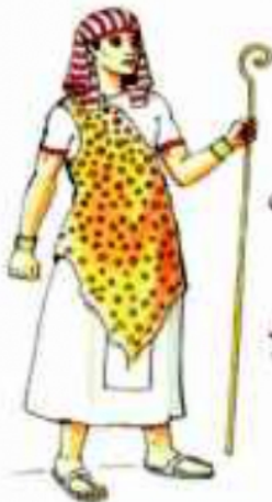
(شكل ٨٦) الوزير