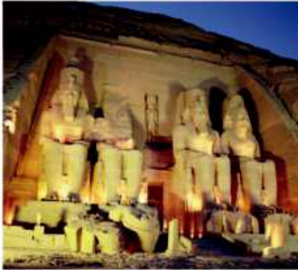
(شكل ٨٣) معبدا أبو سمبل