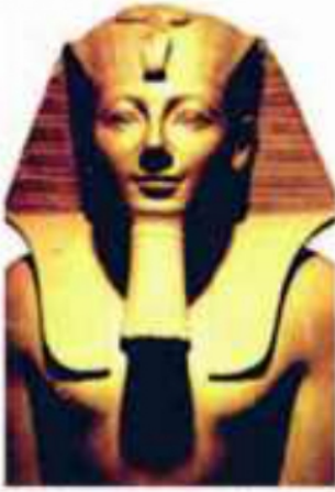
(شكل ٨٠) الملك تحتمس الثالث