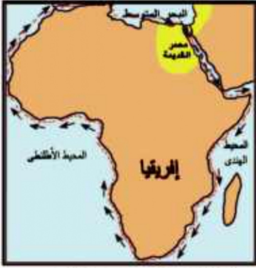
(شكل ٨٤) خريطة الدوران حول إفريقيا

لَكِنَّ عَصْرَ النَّهْضَةِ لَمْ يَسْتَمِرَّ طَوِيلًا ، حَيْثُ غَزَا الْفَرَسُ مِصْرَ عَامَ ٥٢٥ ق. م وَقَضُوا عَلَى الْأُسْرَةِ (٢٦) وَاسْتَمَرُّوا يَحْكُمُونَ الْبِلَادَ حَتَّى الْأُسْرَةِ الثَّلَاثِينَ وَمِنْ بَعْدِهِمْ جَاءَ الْيُونَانِيُّونَ ، ثُمَّ الْبَطَالِمَةُ ، ثُمَّ الرُّومَانُ ، حَتَّى جَاءَ الْفَتْحُ الْإِسْلَامِيُّ لِمِصْرَ عَلَى يَدِ عَمْرُو بْنِ الْعَاصِ عَامَ ٦٤١ م فَخَلَّصَهَا مِنْ يَدِ هَوْلَاءِ الْغَزَاةِ .