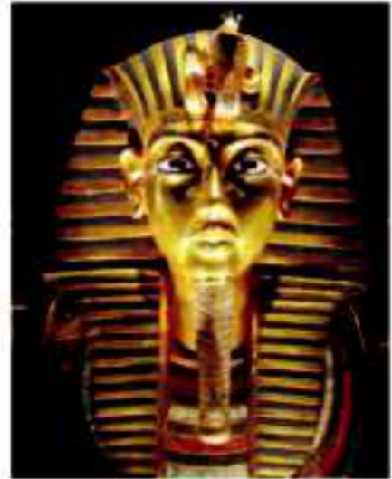
(شكل ٨٢) القناع الذهبي لمومياء الملك ( توت عنخ آمون )

تعود شهرته إلى مقبرته التي تم اكتشافها عام ١٩٢٢م والتي تدل محتوياتها على عظمة الفن المصري القديم الذي بهر العالم كله .