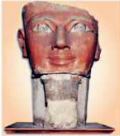
(شكل ٧٩) الملكة حتشبسوت