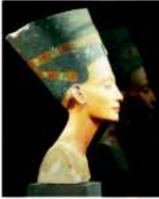
(شكل ٨١) الملكة نفرتيتي