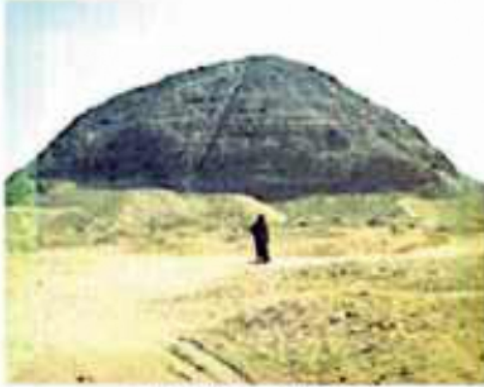
(شكل ٧٥) هرم هواره - الفيوم

فهل تعرف لماذا كان يُلقب بأحد الملوك العظام ؟