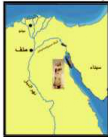
(شكل ٧٤) خريطة قَنَاةِ سِيْزُوسْتَرِيْسِ