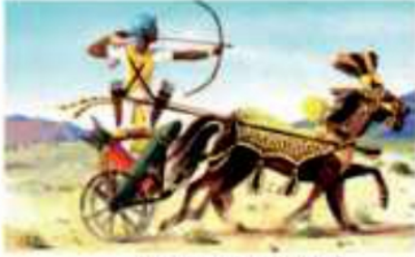
(شكل ٧٦) العجلات الحربية