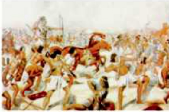
(شكل ٧٧) حرب التحرير

وَالآن تَعَالِ نَتَعَرَّفُ كُلَّ مَنْهُمْ :